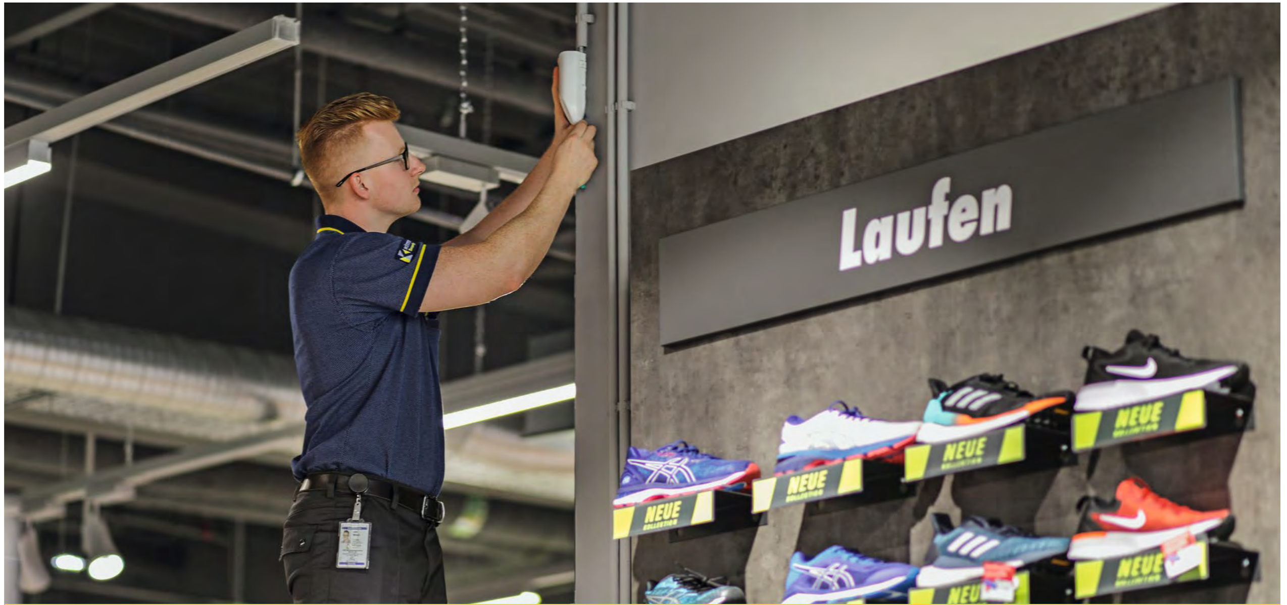
Techniker der KÖTTER Sicherheitssysteme SE & Co. KG betreuen das bundesweite Filialnetz des Sportfachhändlers.

Mit Blick auf den präventiven Schutz von Kunden, Mitarbeitern und Waren stellte neben den Filialen speziell die Sicherheit für das zentrale Warenverteilzentrum in Bochum