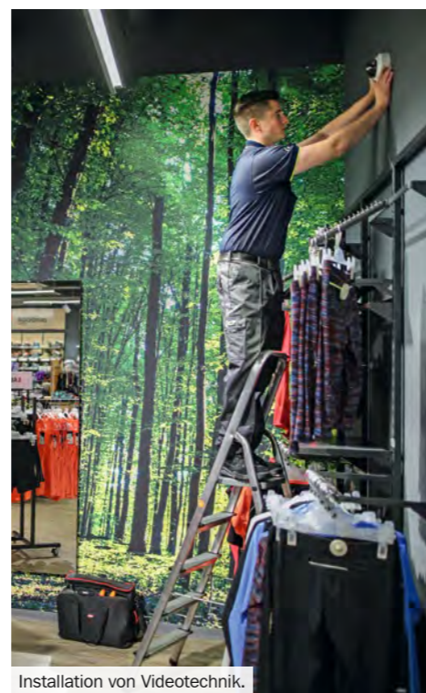
Installation von Videotechnik.