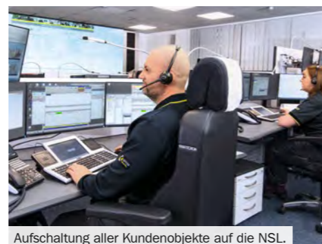
Aufschaltung aller Kundenobjekte auf die NSL.