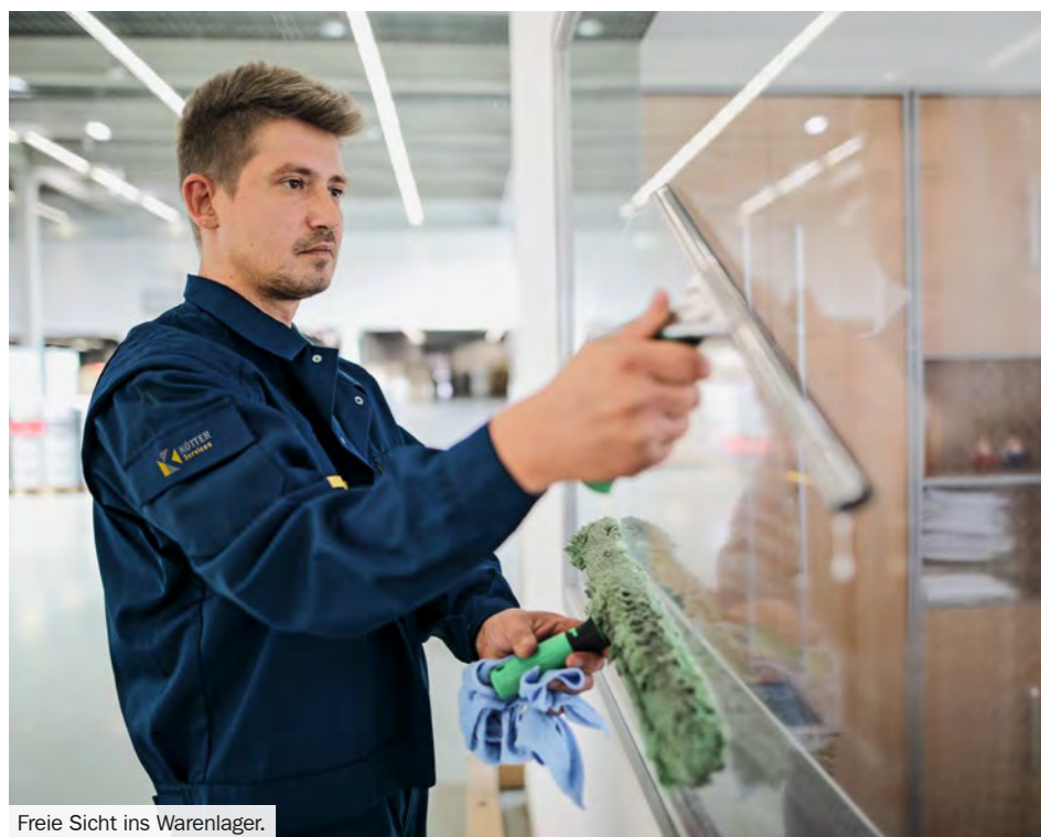
Freie Sicht ins Warenlager.