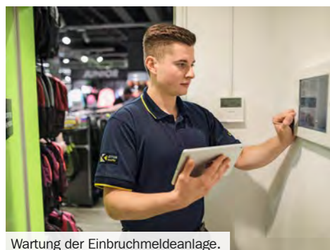
Wartung der Einbruchmeldeanlage.