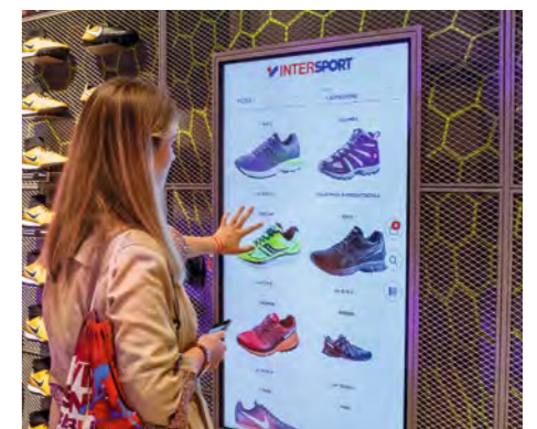
INTERSPORT Voswinkel setzt bei seinen Sportfachgeschäften auf ein modernes Erscheinungsbild und eine gute Übersicht.