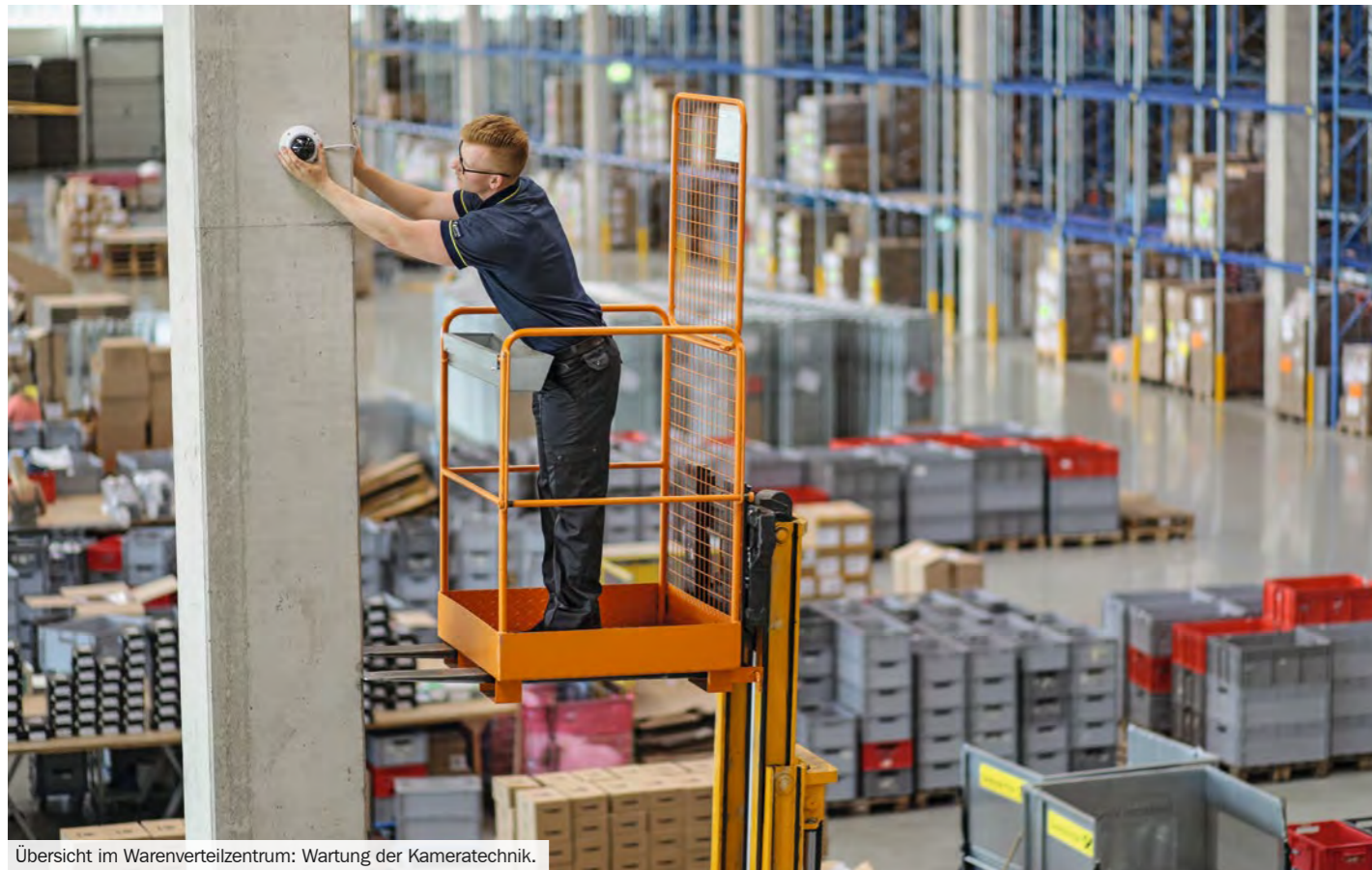
Übersicht im Warenverteilzentrum: Wartung der Kamertechnik.