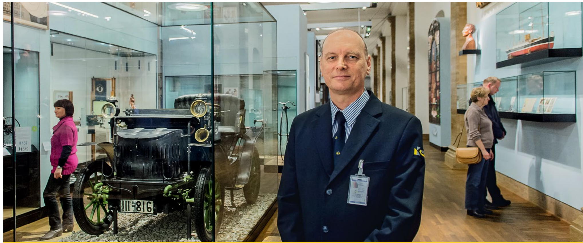
Deutsches Historisches Museum in Berlin: Angenehmes Ambiente und freundlicher Service, z. B. bei den Aufsichtsdiensten, sind entscheidende Bausteine für den Besuchererfolg.