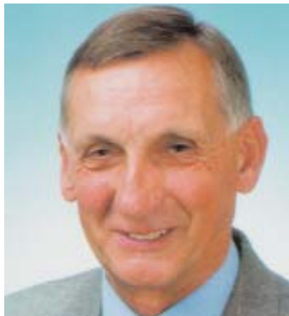
General a. D. Ulrich K. Wegener

Ulrich K. Wegener: Dies trifft pauschal nicht zu. Die Sicherheitsbehörden haben mehrfach Terrorakte vereiteln können - denken Sie allein an die so genannte Sauerland-Gruppe, die Anschläge auf Flughäfen und US-Einrichtungen geplant hatte. Gleichwohl: Der internationale Terrorismus hat